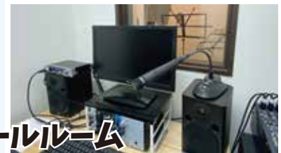
コントロールルーム