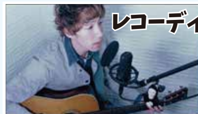
レコーディングブース

普通のレッスンのように発声練習や 伴奏に合わせて歌うことはもちろん、 録音した自分の声をヘッドフォンで聞いて 細かく分析していくことで、より充実した レッスンを行えます。