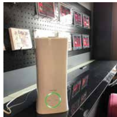
3.次亜塩素酸水で空気の除菌

安心してお越し頂けるよう、最大限の予防対策を行い、スタッフ一同運営して参りますので、引き続きお通いいただけますと幸いです。