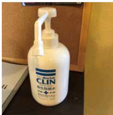
2.アルコール消毒液の設置