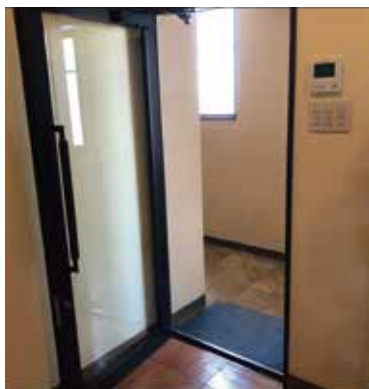
1.ロビーの扉を開放し換気