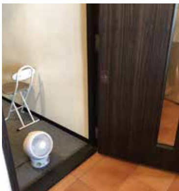
2.スタジオ内を強制換気