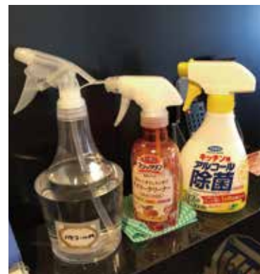
3.アルコールなどを使用し清掃、消毒