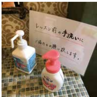
1.徹底した手洗いの実施